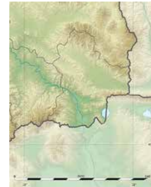
Слика бр. 1 Релјефна карта на Југоисточниот регион

Регионот во целост ги опфаќа споменатите котлини и масивите на планините Беласица на југ, Огражден на исток, Плачковица на север, Срта во централниот дел и на источната страна Кожуф планина.