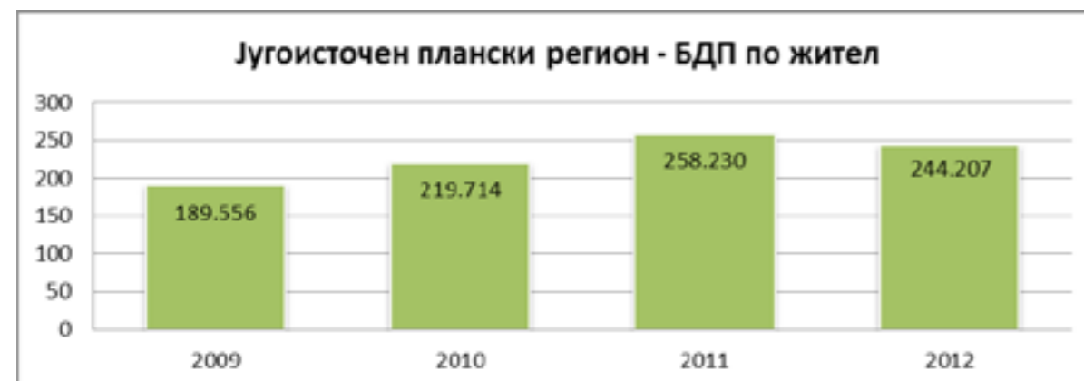
График бр. 1. БДП по жител во Југоисточниот плански регион во периодот 2009 – 2012 година