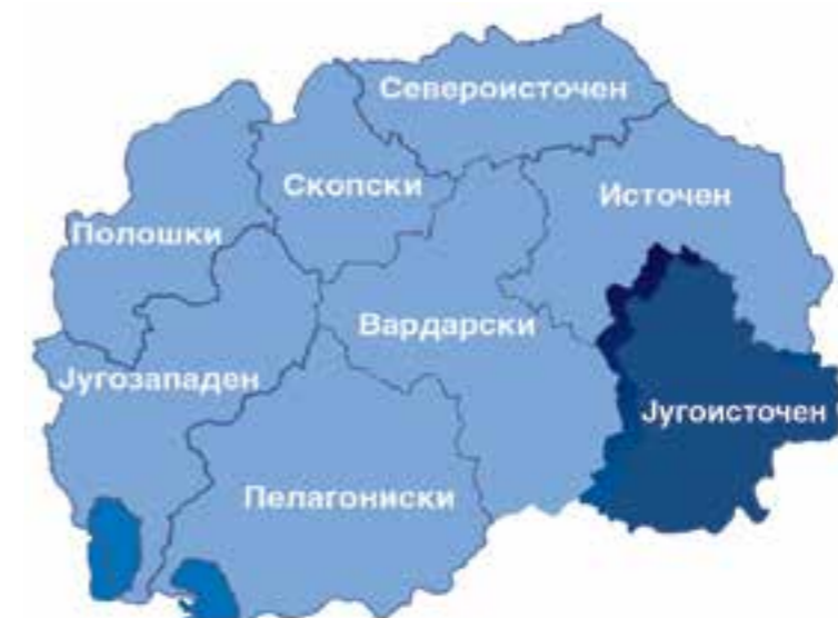
Слика бр. 2 Југоисточен плански регион

Долините на реките Вардар и Струмица овозможуваат комуникациско поврзување на регионот со соседните земји Република Грција на југ и Република Бугарија на исток, а на север и запад со Источниот и Вардарскиот плански регион.